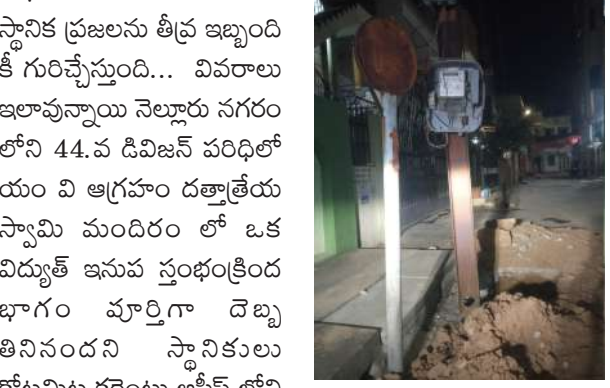
అధికారులు తీసిన గుంట స్థానిక ప్రజలను తీవ్ర ఇబ్బంది కీ గురిచేస్తుంది... వివరాలు ఇలావున్నాయి నెల్లూరు నగరం లోని 44.వ డివిజన్ పరిధిలో యం వి ఆగ్రహం దర్జాత్రేయ స్వామి మందిరం లో ఒక విద్యుత్ ఇసుప స్తంభం క్రింద భాగం మార్చిగా దొబ్బు తినినందని స్థానికులు కోటమిట్ట కరెంటు ఆఫీస్ లోని ఏ ఈ కీ తెలిపారు పెద్దగా స్పందించక పోవడం తో జిల్లా విద్యుత్ శాఖ ఎస్ ఈ కీ తెలియజేశారు... ఆయన స్పందించి దెబ్బ తిన్న స్తంభం స్థానం లో కొత్త స్తంభం ఏర్పాటు చేయాలని ఆదేశించారు... ఆయన చెప్పిన పది రోజులకంటే పక్కన గుంట తీశారు.. గుంట తీశారు మళ్ళీ పట్టించుకోక పోవడం తో ఈ వీధిలో తిరిగే వాహనదారులు మరలం మళ్ళీ భక్తులకు ఈ గుంట వల్ల రాక పోకలకు ఇబ్బంది ఏర్పడుతుంది జిల్లాఎస్ ఈ ఒక్కసారి ద్రుష్టి సారించాలని స్థానికులు విజ్ఞప్తి చేస్తున్నారు..

- జిల్లా ఎస్ ఈసేసిన లెక్కచేయని అధికారులు. - రాత్రి పూట గుంటతో ప్రమాదం... నగరం నడి బోడులో పరిస్థితి నెల్లూరు సీటీ. ఏప్రిల్ 21/ (విజ్ఞాన ప్రతినిధి) ... విద్యుత్ శాఖ